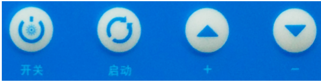
电源开关 启动 转速增加 转速减少